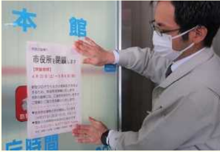
職員の集団感染が発生し、本庁舎の閉鎖を知らせる張り紙をする職員（4月24日、大津市御陵町・市役所）

大津市は4月21日、市職員が相次いで新型コロナウイルスに感染しクラスター（感染者集団）が発生したことを受け、本庁舎（同市御陵町）を25日から5月6日まで全面閉鎖し、業務を停止すると発表した。保健所や市内36カ所の支所は開庁し、コロナ対応や住民票の発行など生活に密接した業務は続ける。自治体の本庁舎閉鎖、業務停止は異例。全面閉鎖するのは、土曜や大型連休を除くと実質4日間となる。期間中、市民からの問い合わせには、外部委託している市のコールセンターで対応する。