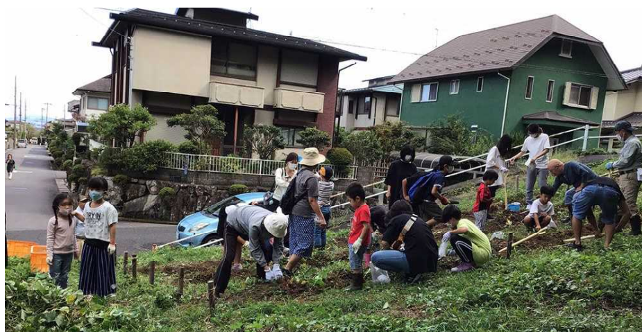
いも掘り 2020. 9. 28