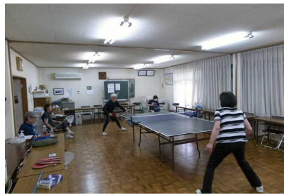
6月18日 卓球しよう 練習再開